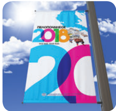
Stands - Rollups